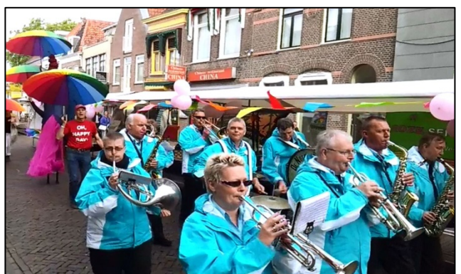
Allereerste 'West-Friese Streetgayparade' 2012