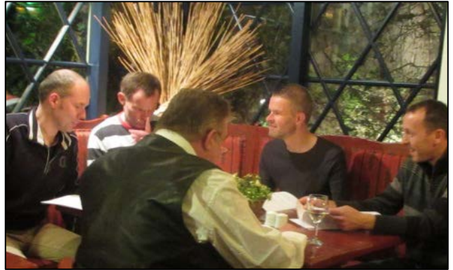
Hpg - Hauwert