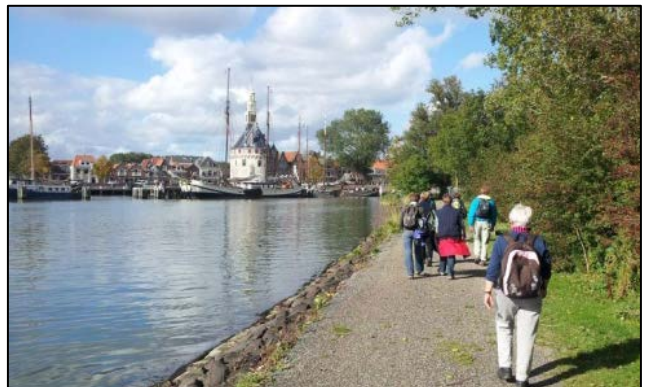
LaFemme WandelEn - Hoorn