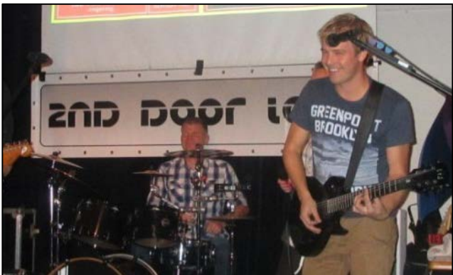
Slotfeest - Hoorn