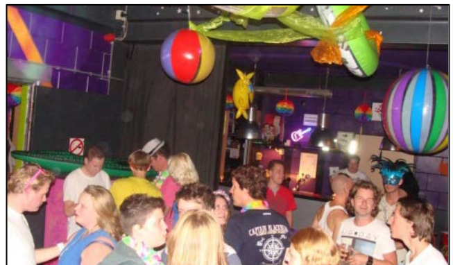
Rainbowparty - Stede Broec