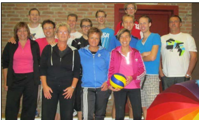
Volleybal - Westwoud