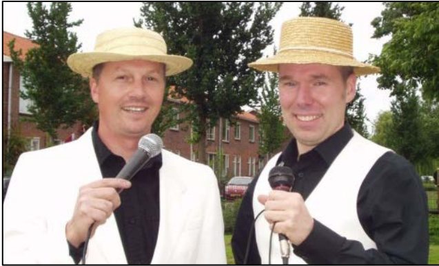
WFGAY Feest - Hoorn