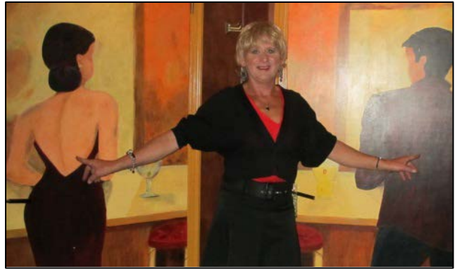
Transgenders - Hoorn