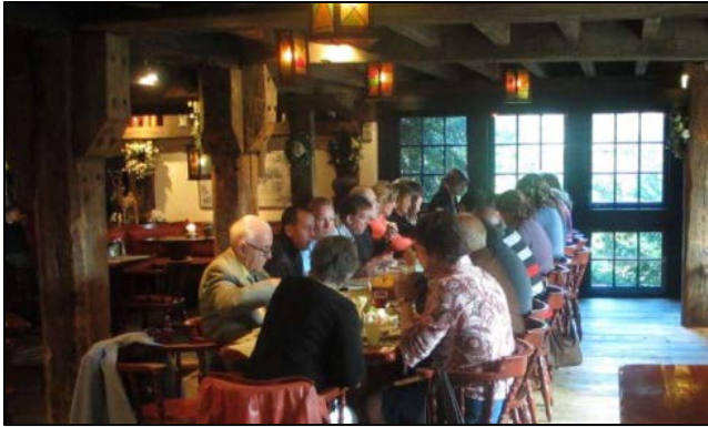
Weekendlunch - Hauwert