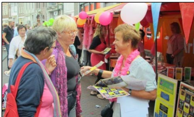
Promotiecampagne - Roze Zaterdag Haarlem 2012