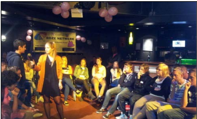
Scholierendebat - Hoorn