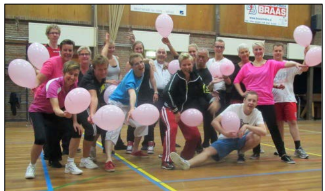
Zumba Dance - Westwoud