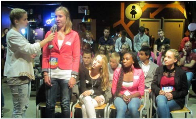
Scholierendebat - Stede Broec