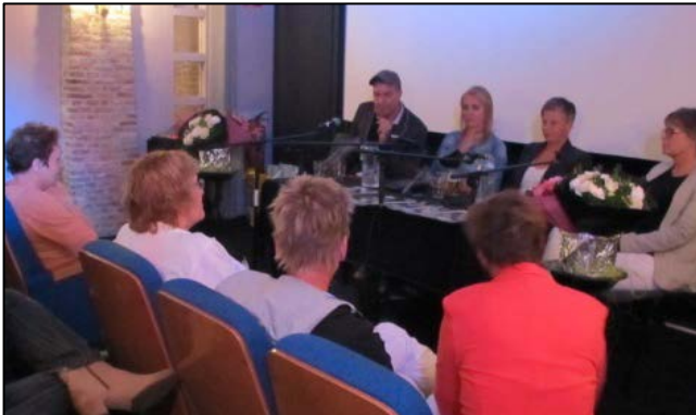
LaFemme 'Girls Talk' - Hoorn