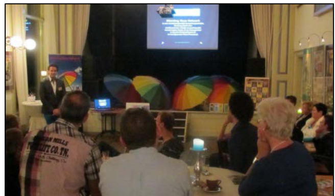
Ouders Roze Kinderen - Hoorn