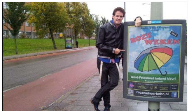
Promotiecampagne - Hoorn