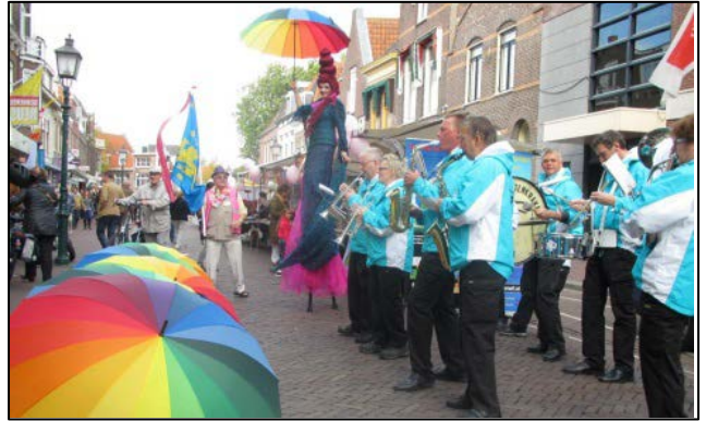
Informatiemarkt - Hoorn