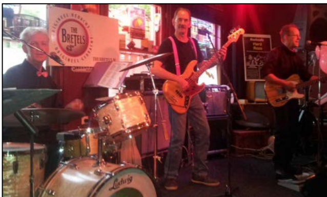
Familiedag - Westwoud